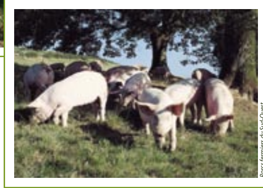
Porcs fermiers du Sud-Ouest